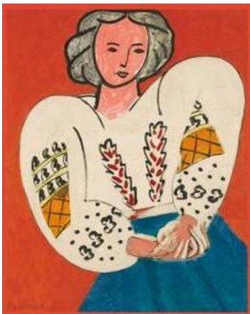
Henri MATISSE : "La blouse roumaine"